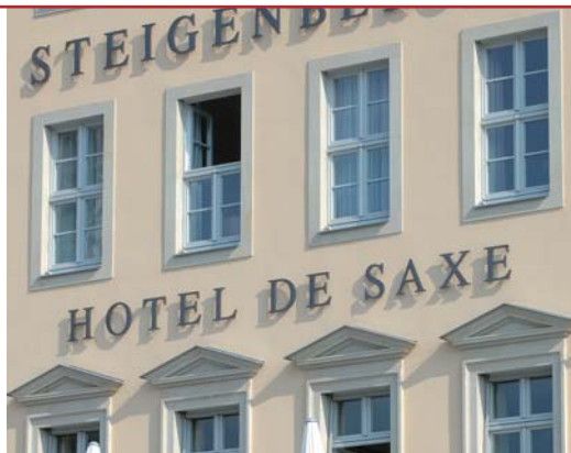
Detailgetreu: Die sensible Fassadengestaltung des „Hotel de Saxe“ zitiert den Ursprungsbau.

Das östlich der Kirche gelegene Projekt „QF“ (Quartier an der Frauenkirche) und das weiter südlich fertiggestellte „Hotel de Saxe“ (Quartier IV an der Frauenkirche) sind zwei von mehreren Projekten im Umfeld des barocken Gotteshauses, mit deren Realisierung in den letzten Jahren begonnen wurde. Die Wiederbebauung gibt Dresden seine einstige Identität zurück und schafft gleichzeitig ein modernes urbanes Zentrum.