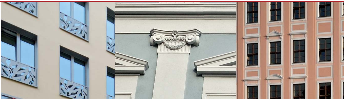
Verspielte Elemente wie diese floral gestalteten Brüstungen bieten attraktive Blickpunkte.

Eine elegant zurückhaltende, zeitlose Architektursprache zeigt das von den Frankfurter Architekten Wörner & Partner entworfene Eckhaus direkt gegenüber der Frauenkirche, in dessen Erdgeschoss sich ein Juwelier eingerichtet hat. Links daneben liegt das ebenfalls von Wörner & Partner entworfene Eingangsgebäude zur Passage. Das Haus wurde mit einer treppenartig abgestuften Fassade aus Naturstein ausgebildet, der sich jedoch in Farbe und Struktur ganz bewusst vom Stein der Frauenkirche gegenüber unterscheidet.