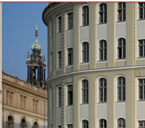
Eleganter Schwung: Das „Hotel Stadt Berlin“ schafft einen markanten Blickfang am Neumarkt 1.