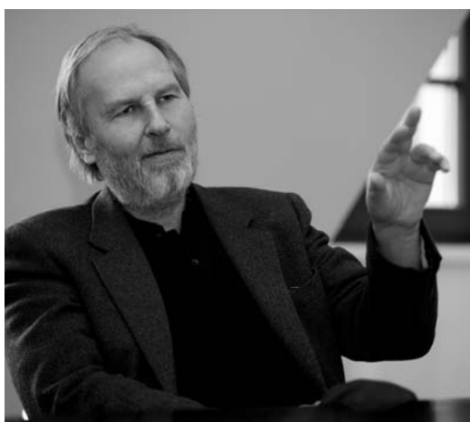
Architekt Kai von Döring favorisierte für das QF eine differenzierte und kleinteilige Nutzung und Architektur.

Das gesamte Ensemble besteht aus neun Häusern, die eine dreigeschossige Passage im Innenhof des Komplexes umschließen. Ein markantes Glasdach über der Passage schafft ein helles und freundliches Ambiente, das Raum für das Lichtspiel wechselnder Tages- und Jahreszeiten lässt und von vielen Stellen aus einen eindrucksvollen Blick auf die Kuppel der Frauenkirche bietet. Ein weiteres gelungenes Detail ist der nach historischem Vorbild als Oktagon gestaltete Innenhof im Weigelschen Haus am Neumarkt 2.