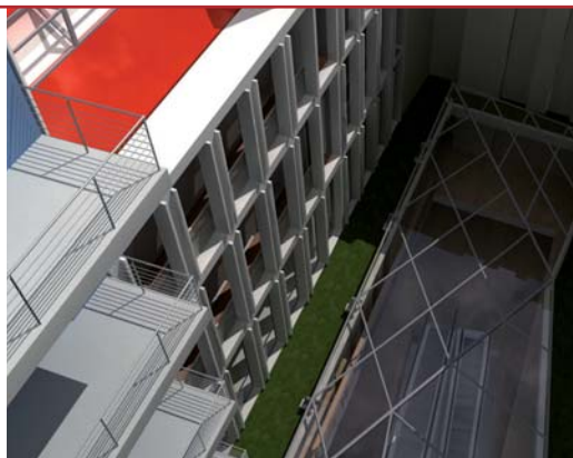
Faszinierender Blick von oben auf das Glasdach über der Galerie.