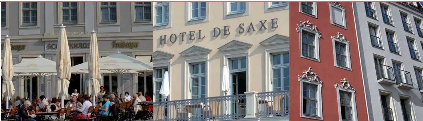
Lebendige Atmosphäre im neuen Quartier IV am Neumarkt.

Die reichhaltige Ornamentik der Fassaden wurde mit individuell gefertigten alsecco Fassadenprofilen ausgebildet. Eine weitere Herausforderung bei der Gestaltung der Fassade des Hauses in der Landhausstraße war die gemeinsam mit dem Planungsservice von alsecco realisierte Umsetzung der filigranen Verzierungen. Durch die originalgetreu nach photogrammetrischen Aufnahmen rekonstruierten Rocailles erstrahlt das Haus inzwischen wieder wie zu Zeiten des Rokoko.