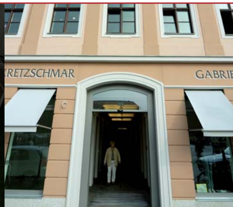
Publikumsmagnete im QF sind zahlreiche kleine attraktive Läden.