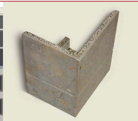
Individuell gefertigtes Formteil für die vorgehängte Natursteinfassade.