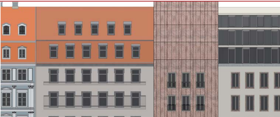
Die Gebäudezeile zeigt ein kontrastreiches Zusammenspiel verschiedener Materialien.

Um für das städtebaulich wichtige Eingangsgebäude der Galerie eine ästhetisch überzeugende und sichere Vorhangkonstruktion zu erzielen, entwickelten Planer von alsecco eine speziell angepasste Detaillösung mit zahlreichen individuell gefertigten Formteilen für die exakte Umsetzung des Entwurfes. Die Kombination des hochwertigen Materials mit einem effizienten Wärmedämm-Verbundsystem bietet eine optimale Synthese aus Flexibilität und Wirtschaftlichkeit.