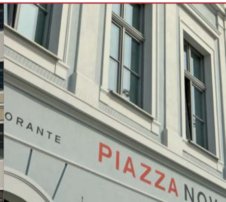
Gelungene Rekonstruktion: Detail des Hauses „Goldener Ring“ am Neumarkt 3.