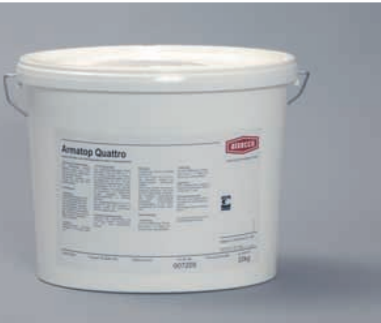
Armatop Quattro ist die organische Premium-Klebe- und Armierungsmasse für alsecco Fassadensysteme.

Seine außergewöhnliche Stoßfestigkeit hat Armatop Quattro nach den von der europäischen Zulassungsbehörde EOTA formulierten Prüfkriterien mehrfach unter Beweis gestellt. Besonders auch die extrem beanspruchten Eingangs- und Sockelbereiche schützt Armatop Quattro effektiv und dauerhafter vor Schäden durch typische mechanische Beanspruchungen.